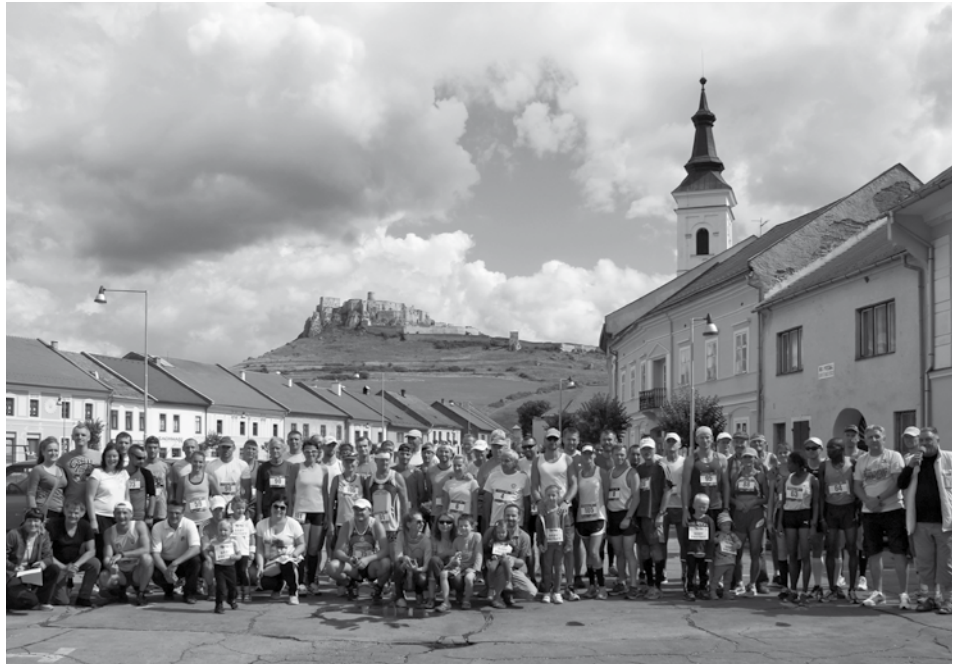
20 mierových kilometrov okolo Spišského hradu (viac na str. 11)

Objednaj si dve pizze priamo v pizzerii a dostaneš dva drinky grátis!