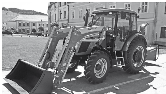
Nová technika pre naše mesto (viac na str. 3)