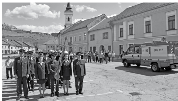
Odvzdanie nového hasičského auta (viac na str. 3)