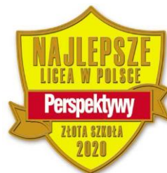
Miejsca LOTE w rankingu szkół