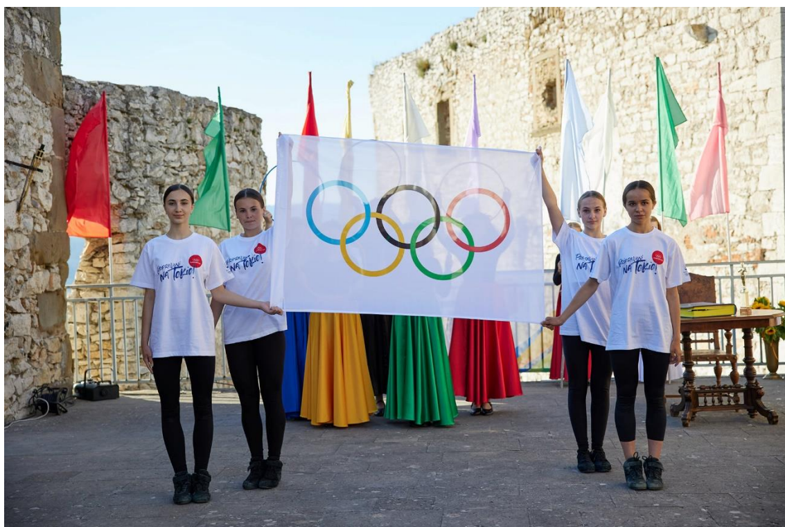
obr. č. 1 Oceňovanie najúspešnejších športovcov Spiša na Spišskom hrade dňa 16.06. 2021.