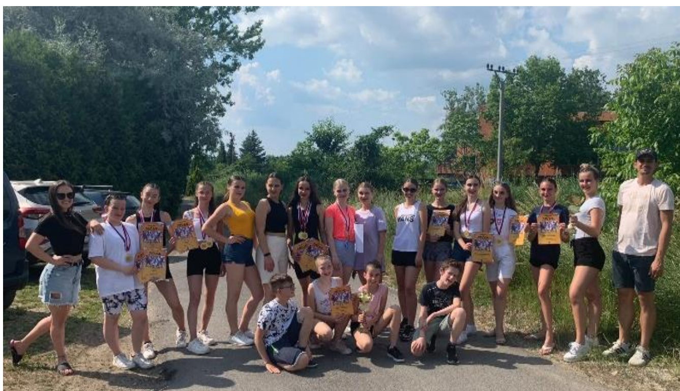
obr. č. 5