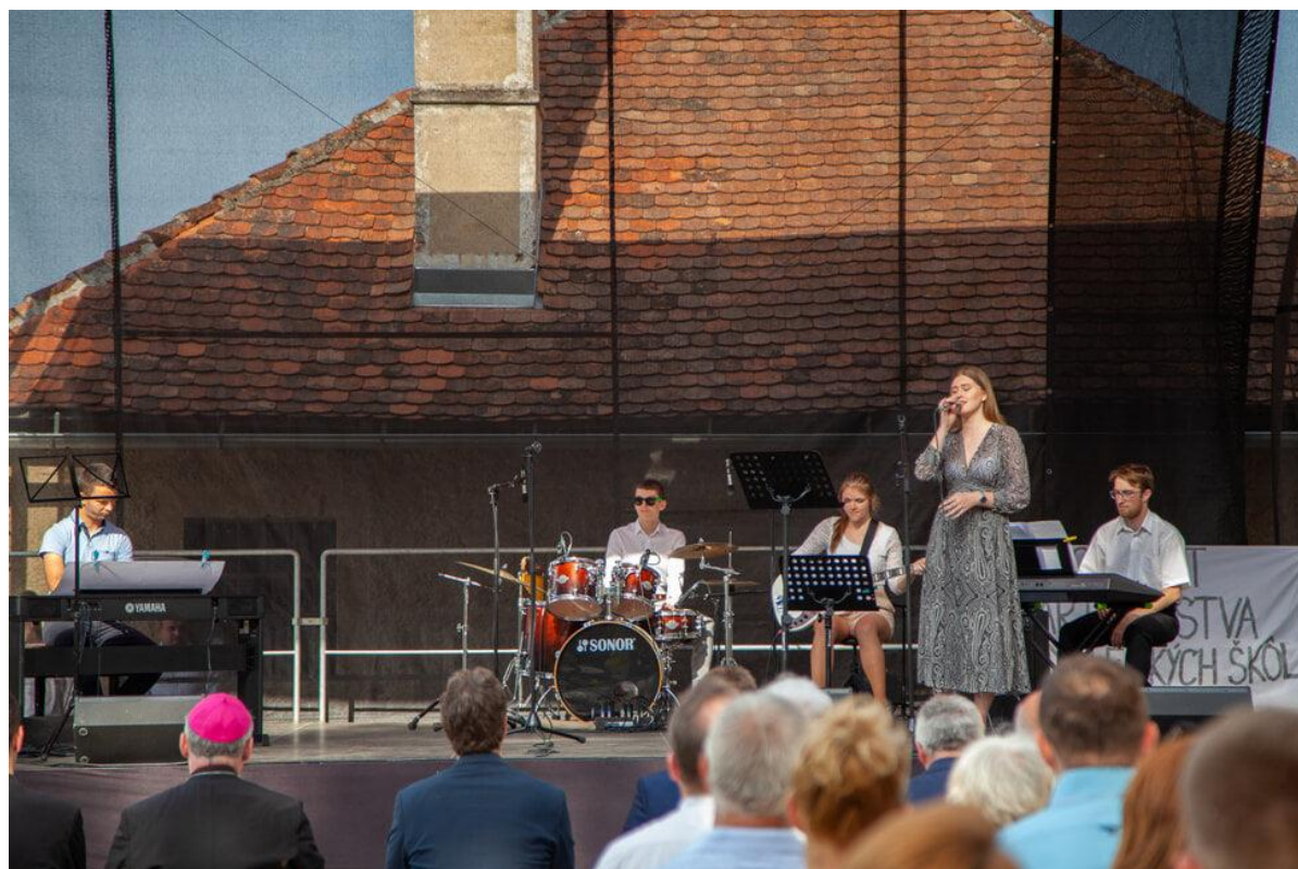
obr. č. 2

Koncert priateľstva ZUŠ Spišské Podhradie a Szkoły Muzycznej z Glogowa Malopolského. Slávnostné požehnanie Biskupskej záhrady v Spišskej Kapitule dňa 24. 06. 2021.