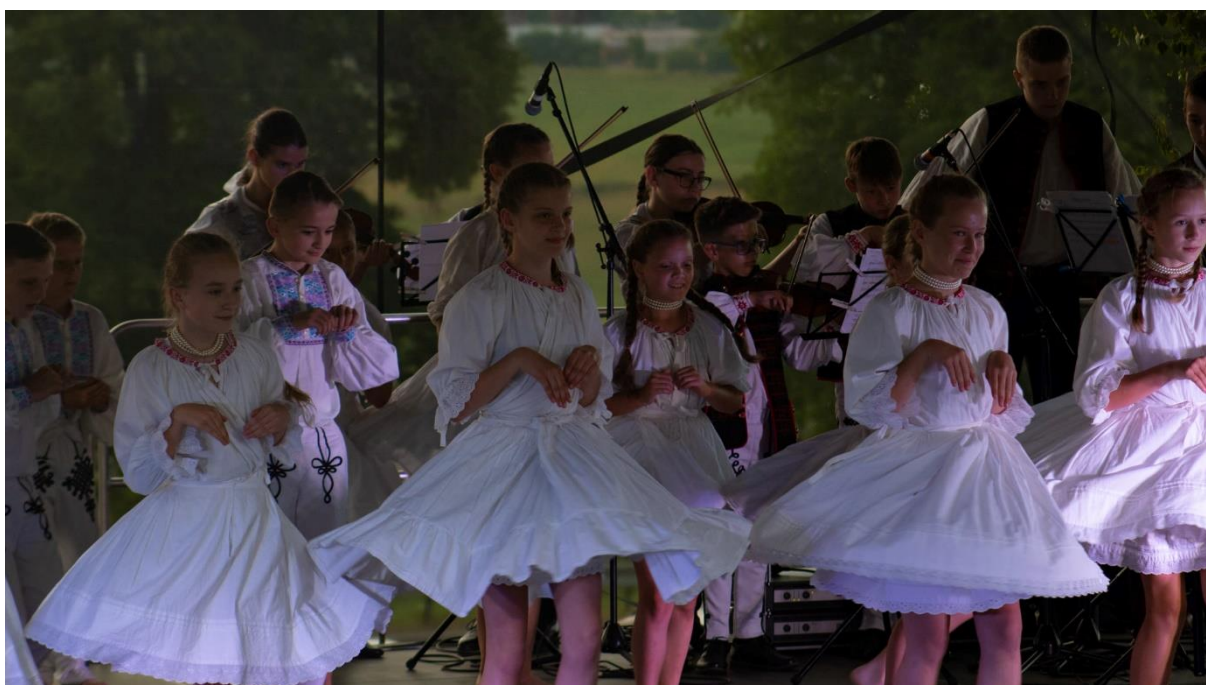
obr. č. 3 Jánske ohne na Spišskom salaši dňa 26. 06. 2021.