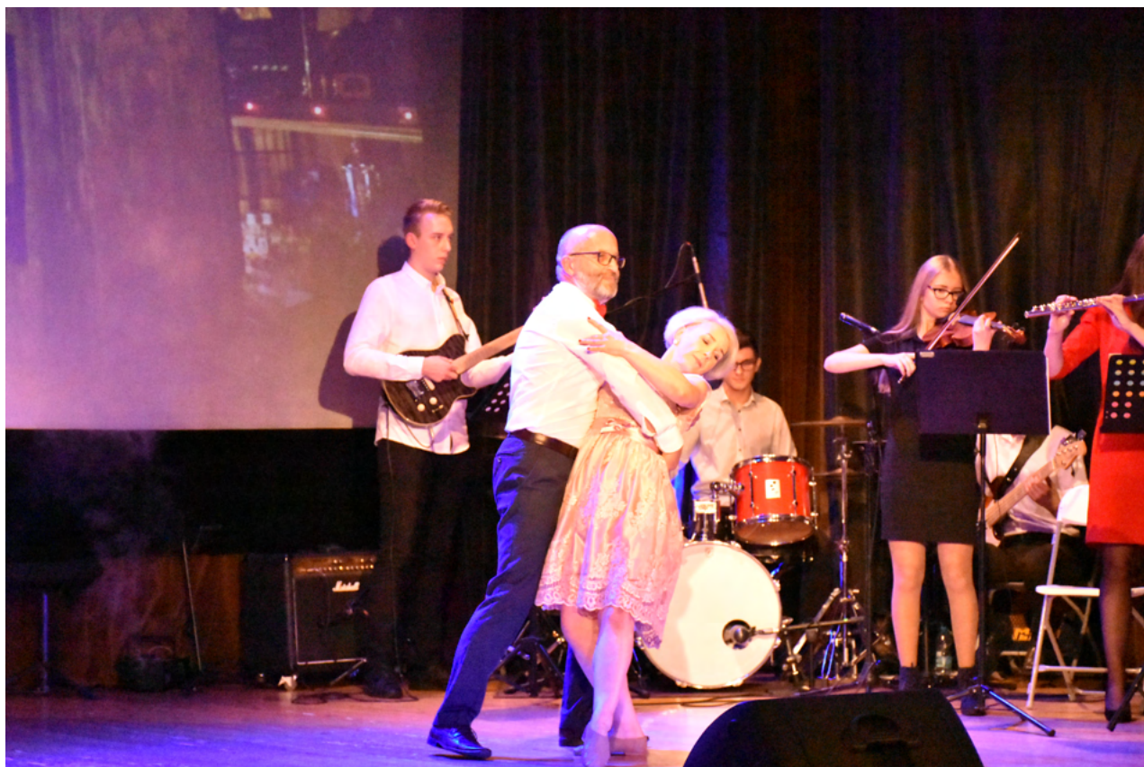
Nauczyciele i uczniowie Liceum na wspólnej muzycznej scenie.