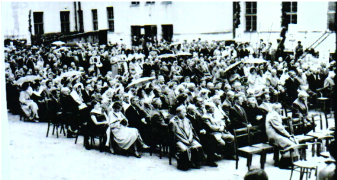
Uczestnicy Jubileuszu 50-lecia Szkoły