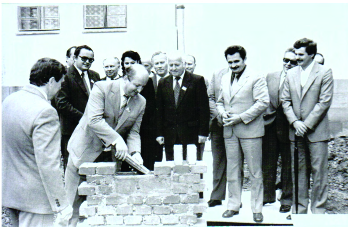
Wmurowanie kamienia węgielnego pod salę gimnastyczną