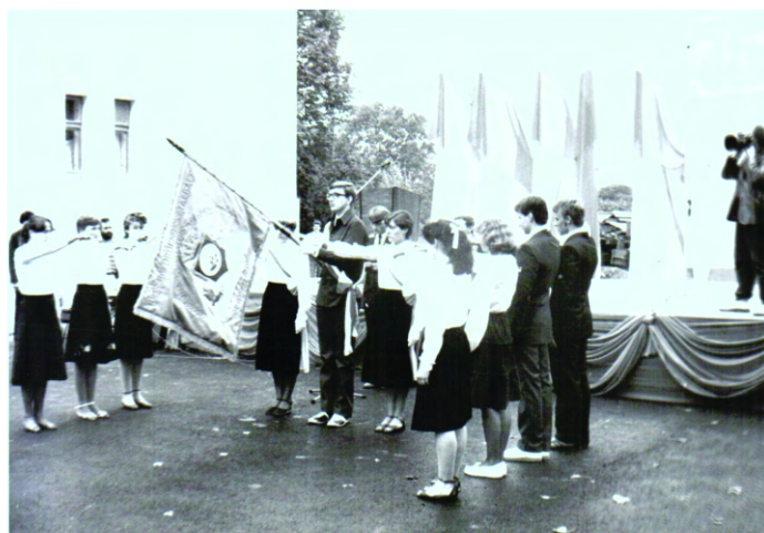
Pierwsze ślubowanie na sztandar Szkoły