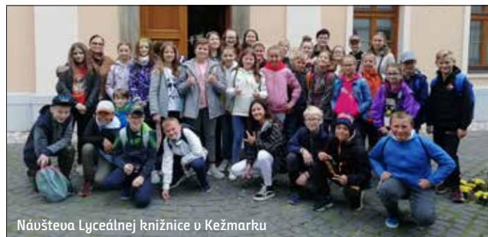
Návšteva Lyceálnej knižnice v Kežmarku