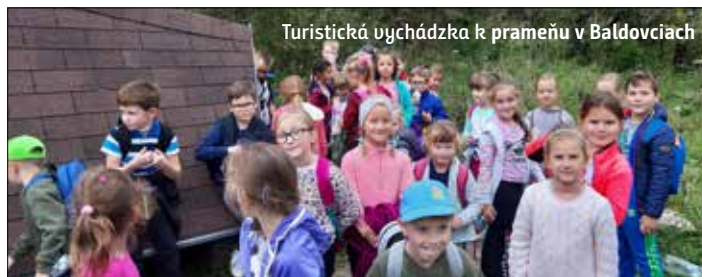
Turistická vychádzka k prameňu v Baldovciach

a ochotným rodičom sme ušetrili nemalé finančné prostriedky. Zakúpili sa aj skrine na prezuvky pre žiakov na II. stupni. Pevne veríme, že aj to prispeje k väčšiemu pohodliu našich žiakov a čistote školského prostredia.